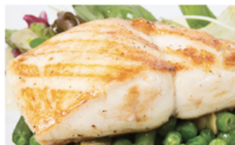
EGLEFIN FILET S/PEAU 130/200 CHINE - SAC 800 G 1003019 SURGÈLE