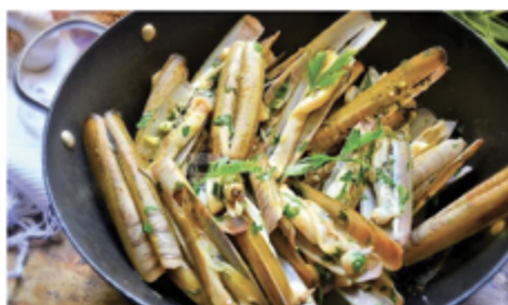
COUTEAUX CRUS HOLLANDE SAC 1 KG 1002074 SURGÈLE