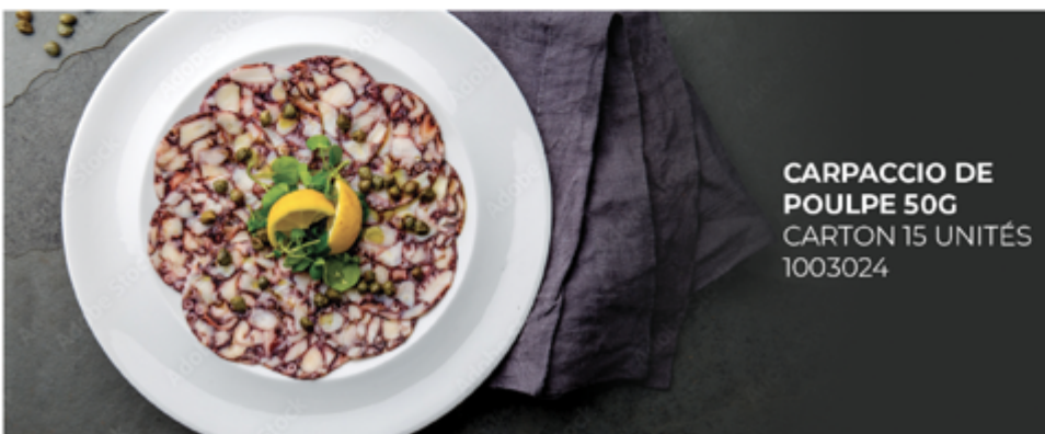
CARPACCIO DE POULPE 50G CARTON 15 UNITÉS 1003024