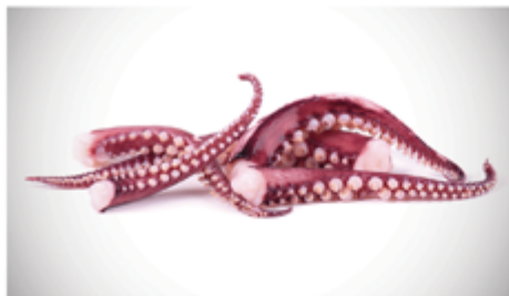
TENTACULE ENCORNET GÉANT CRUE - BARQUETTE 800 G 1002070 SURCELÉ