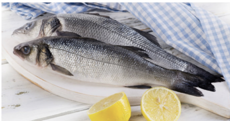
BAR ENTIER ECAILLÉ VIDÉ 300/400G CARTON 5 KG 1004001 SURCELÉ