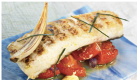
DOS DE COLIN BLANC IQF 140/160G - CARTON 5 KG 1003006 SURGÈLE