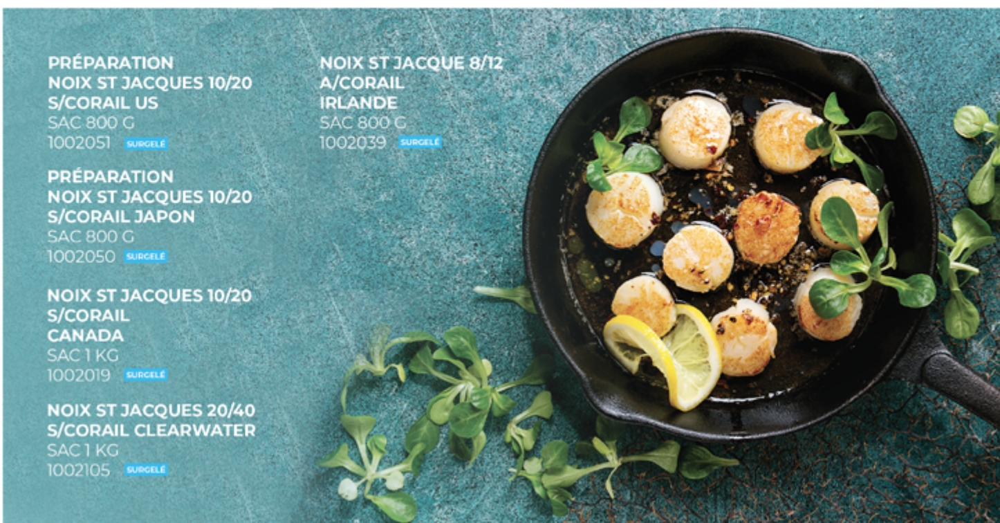
PRÉPARATION NOIX ST JACQUES 10/20 S/CORAIL US SAC 800 G 1002051 SURGÈLE