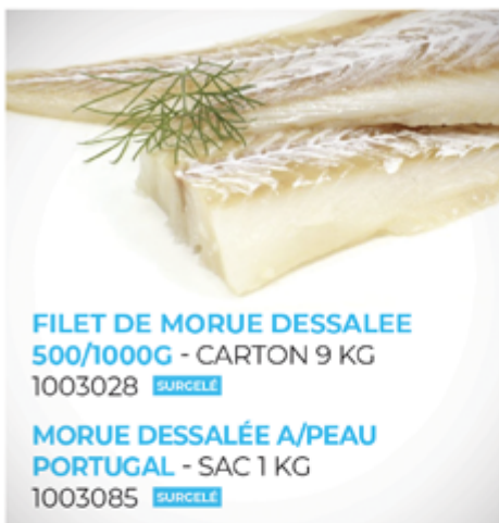
FILET DE MORUE DESSALEE 500/1000G - CARTON 9 KG 1003028 SURCELÉ