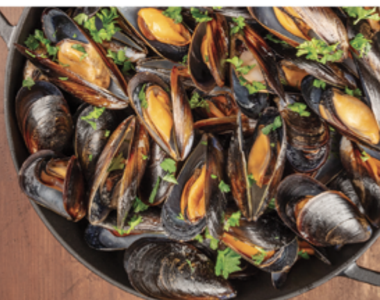
MOULE PLEIN EAU NATUREL 60/80 SAC 1 KG 1002016 SURGÈLE