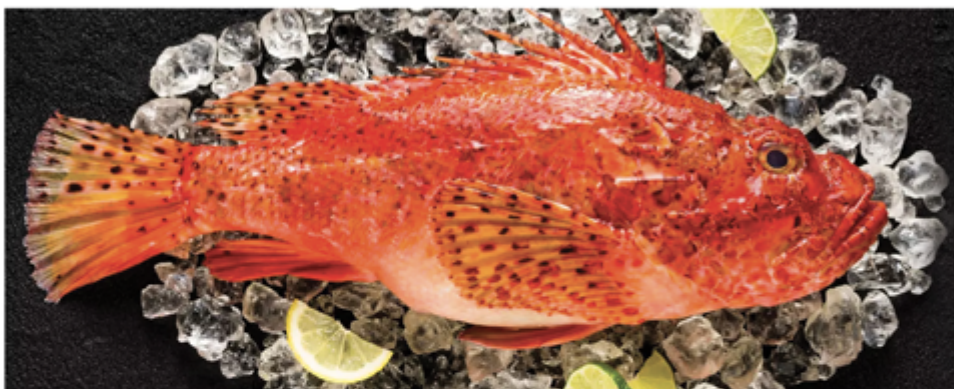
FILET DE RASCASSE DU NORD A/PEAU 110/160G SAC 800 G 1003022 SURGÈLE