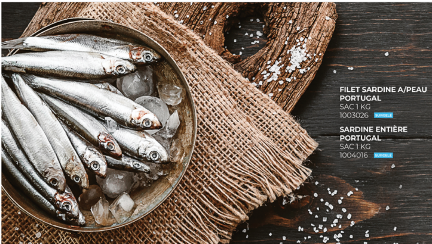
FILET SARDINE A/PEAU PORTUGAL SAC 1 KG 1003026 SURGÈLE