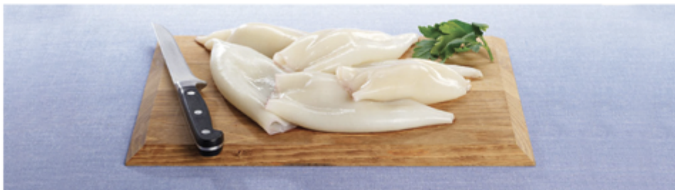
TUBE ENCORNET 8/12 CHINE SAC 1 KG 1002030 SURCELÉ