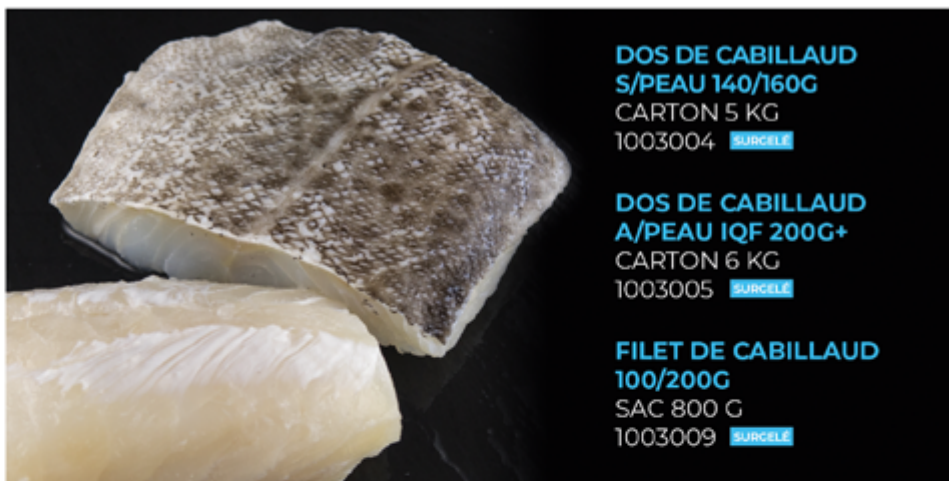
DOS DE CABILLAUD S/PEAU 140/160G CARTON 5 KG 1003004 SURCELÉ