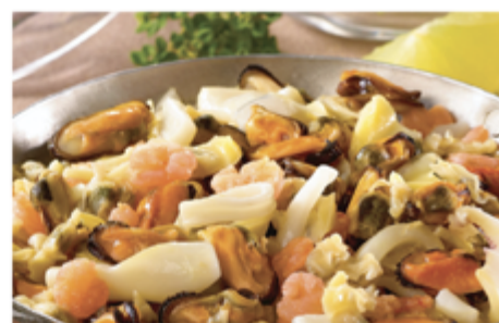
COCKTAIL FRUITS DE MER SAC 1 KG 1002043 SURGÈLE