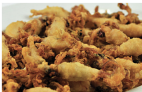
PUNTILLA FARINÉ CAUDALIE BOITE 2 KG 1002038 SURGÈLE