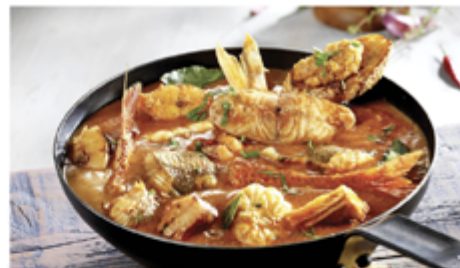
BOUILLABAISSE ROYALE BARQUETTE 3 KG 1004002 SURGÈLE