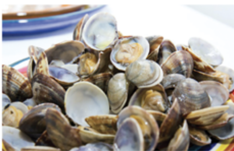
PALOURDES 40/60 VIETNAM CYTHERÉE - SAC 1 KG 1002067 SURGÈLE