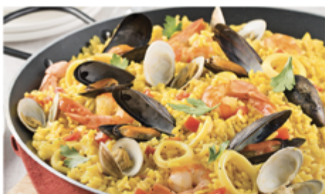
PRÉPARATION PAËLLA SAC 850 G 1002017 SURGÈLE