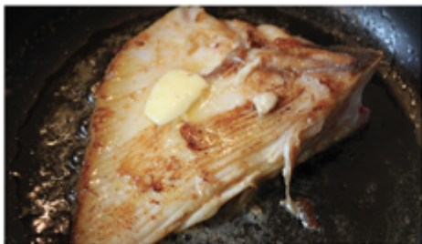
AILE DE RAIE 100/400G SAC 1 KG 1003001 SURGÈLE