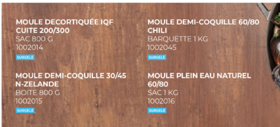
MOULE DECORTIQUÉE IQF CUITE 200/300 SAC 800 G 1002014 SURGÈLE