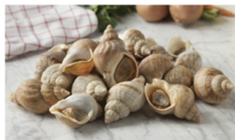
BULOT CUIT IRLANDE SAC 1 KG 1002003 SURGÈLE